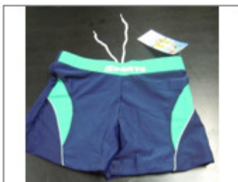
BAÑADOR DE NIÑO, MARCA MO LI HUA, REF. 22907 (TALLA 8) 550/2015