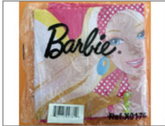
COLCHONETA HINCHABLE "BARBIE", REF. X0176 498/2015