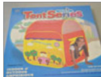
CASITA DE TELA, MARCA ELEGANT, REF. 0805Z119 23/2015