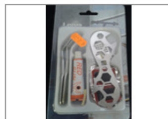
SET DE BICICLETA CON LLAVES DE DISTINTOS TIPOS, PARCHES Y UN TUBO DE PEGAMENTO "RED SUN", MARCA LEIV... 529/2015