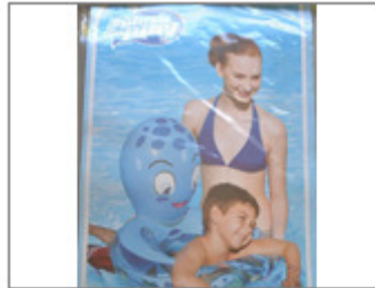
FLOTADOR DE ARO CON CABEZA DE PULPO, MARCA BESTWAY, REF. 36106 482/2015