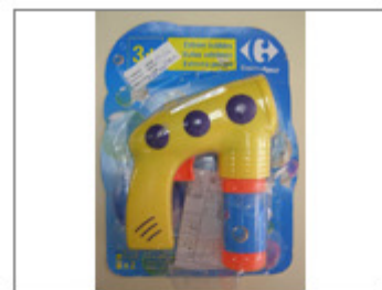
PISTOLA DE PLÁSTICO AMARILLO PARA HACER POMPAS DE JABÓN "EXTREME BUBBLES", MARCA CARREFOUR (TY53964,... 42/2015