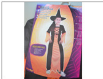
DISFRAZ DE BRUJA NARANJA, MARCA BOYS TOYS, MODELO NW10B00183 530/2015