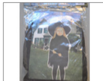
DISFRAZ DE BRUJA "WITCH SET", MARCA GRUPO OTOÑO 540/2015