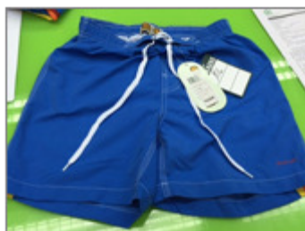
BAÑADOR PARA NIÑO, MARCA GO & WIN, MODELO BERMUDA ARCO JR, REF. 0011802/14 539/2015