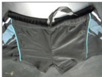
BAÑADOR INFANTIL, MARCA MEDIALIST, REF 31102, TALLA 10 547/2015